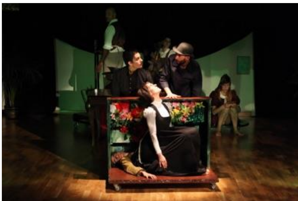
FOTO es una obra de teatro de medio formato altamente visual y con un espacio sonoro en vivo. FOTO abre la puerta del antiguo casón de una familia burguesa de finales del siglo XIX. Las paredes hablan, y los sirvientes susurran sobre los amos en una casa donde los secretos llevan demasiado tiempo enterrados.