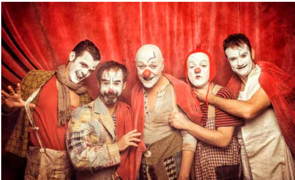
Clip de video

Rhum&Cia inició su trayectoria en 2014 con Rhum y le han seguido Rhümia en 2016, Rhumans en 2018 y Gran reserva en 2020. Hasta finales de 2019 han visitado más de 65 teatros (20 fuera del territorio catalán), han hecho 225 representaciones que han sido vistas por más de 50.000 espectadores. Han estado presentes en 3 ocasiones en el Festival Grec de Barcelona y han hecho un total de 5 temporadas en el Teatre Lliure.